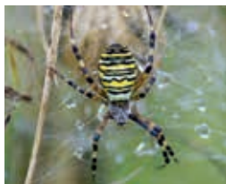
Argiope frelon – G. Blandenier

Rdv au parking au bas du village, vers la maison de L'Etivaz. Court déplacement, exposé sur la biologie et l'écologie de ces espèces, écoute de leurs ultrasons, capture dans le cadre de l'inventaire de la réserve et observation. Lampe de poche et vêtements chauds indispensables. Retour 22h30. Renvoi au 13 août en cas de mauvais temps.