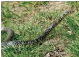
Couleuvre verte et jaune – S. Ursenbacher

Rdv à Echallens gare. De Lausanne-gare bus LEB 78048 9h07, changer à Prilly-Chasseur, train LEB 9h32, arr. 9h52; d'Yverdon-gare bus 670 9h27, arr. 9h58. Pique-nique. Retour vers 15 h, bus TL 60 de Froideville aux 20 et 50, ou plus tôt depuis Cugy.