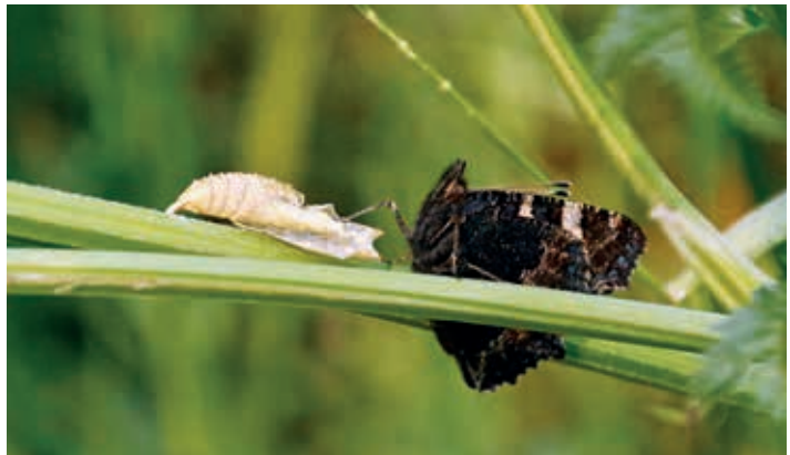
Petite tortue – Giulio Genoni

Ces excursions sont ouvertes aux membres et aux non-membres. Elles ont lieu, sauf avis contraire, par tous les temps et se déroulent sous la responsabilité des participant(e)s. Equipement: bonnes chaussures pour la marche, vêtements adaptés, protection contre tiques et moustiques, protection solaire, jumelles, loupe, lampe frontale pour les excursions du soir, guide d'identification des espèces, pique-nique et boissons. Inscription obligatoire. Les prescriptions relatives à la lutte contre la pandémie du coronavirus seront appliquées.