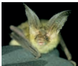
Oreillard roux – M. Bastardot

Rdv à la gare d'Aigle. Train de Lausanne 12h21, arr. 12h52. Covoiturage jusqu'au lac Lioson (indiquer le nombre de places offertes/demandées). Retour dès 17h, trains fréquents. Annulation en cas de pluie.