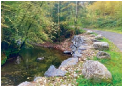
Le Talent – P. Steiner

Rdv à l'arrêt Champ-Pittet. Train de Lausanne 8h30, d'Yverdon 9h18, arr. 9h20. Marche facile jusqu'à l'Escarbille et retour pour observer les oiseaux chanteurs, pics, rapaces, etc. Pique-nique. Retour vers 15h, trains aux 07 et 37.