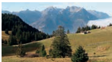
Les Agittes – R. Keller

Initiation à la photographie nature macro avec Christophe Estermann. Inscription à donatura@sunrise.ch. Dès 14 ans. Quelques contorsions nous permettront de découvrir l'incroyable variété de formes de vie, de couleurs et de lumières. Appareil photo numérique, réflex ou hybride et, si possible, un objectif macro ou entre 50 et 200 mm et bagues-allonges. Rdv à la gare (pas de parking). Train de Lausanne 9h01, d'Yverdon 8h58, changer à Cossonay, arr. 9h35. Pique-nique. Retour 15h23. Renvoi au 18 juin en cas de temps peu lumineux.