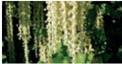
Garrya elliptique – F. Hoffer-Massard