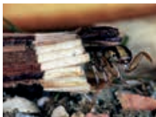
Larve de phrygane – G. Genoni