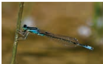
Agriion nain – A. Vallat

Rdv au rond-point à l'ouest de Grand-Rue 2 (6 min de la gare et 1 min du parking Parc des Sports). Train de Lausanne 8h51, arr. 9h14. Retour dès 12h15, cadence demi-horaire. Renvoi au 9 juillet en cas de pluie.