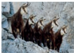
Chamois – J. Erard

Les papillons de nuit avec le lépidoptériste Pierre Pury. Inscription à pierre.pury@urbanet.ch. Max. 30 personnes. Nous attirerons ces pollinisateurs à l'aide de faibles lampes UV. Rdv à l'UNIL en lisière de forêt à l'est du Biophore. Bus 31 ou métro M1, arrêt UNIL-Sorge, ou parking au nord de l'Amphimax, puis 5 minutes à pied. Retour 23h30. En cas de conditions défavorables renvoi au 28 mai.