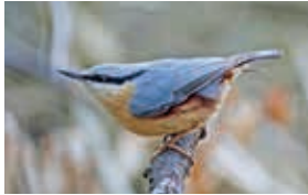
Sittelle torchepot – G. Porchet

Rdv au bas de l'escalier de la gare de Territet. Train de Lausanne 8h30, arr. 9h02. Marche facile vers Montreux. Retour l'après-midi, trains fréquents. Possibilité d'interrompre la balade (bus), de manger dans un restaurant ou de pique-niquer.