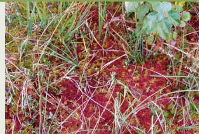
Les sphaignes rouges ou vertes sont de vraies éponges qui se gonflent d'eau de pluie.

Pro Natura proposa aux communes de Semsales et de La Rogivue, propriétaires, d'y créer une réserve naturelle, un avenir plus passionnant que les projets de décharges prévus alors. Une gestion appropriée pouvait recréer des milieux naturels de grande valeur. En 1974, Pro Natura acheta 25 hectares de marais, qui devinrent le cœur de la réserve naturelle.