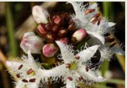
En avril, les étoiles cotonneuses du trèfle d'eau s'épanouissent dans les gouilles.

En été, un reflet bleuâtre domine dans les prés. La plante responsable de cette teinte peu courante est la molinie, une graminée typique des marais qui s'assèchent.