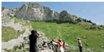
Sous Famelon – G. Genoni

Rdv à Chamblon Casernes. Train de Lausanne 9h15, à Yverdon bus 611 9h44, arr. 9h54. Marche facile pour observer bocages, prairies, bruants, alouettes, rossignols, pies-grièches, rapaces. Pique-nique. Retour de Suscévaz Village, bus 680 15h03.