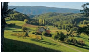
Vallon de l'Aubonne – S. Meier

Train de Lausanne 7h21, changer à Aigle, arr. Leysin-Feydey 8h23. Sentier de montagne, pique-nique. Retour 16h58.