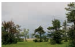
Grande Caricaie – G. Genoni