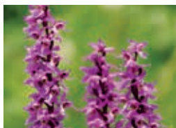
Orchis mâle – G. Genoni

Rdv à la capitainerie du port (parking payant). Train de Lausanne 8h13, bus 544 de Domdidier 9h33, arr. Portalban Village 9h46, puis 5 min à pied. Marche facile jusqu'à Cudrefin, pique-nique. Retour en bateau dès 14h30.