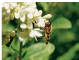
Syrphe du groseiller – G. Genoni

En cas de très mauvais temps renvoi au 4 juin.