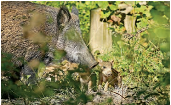
Sangliers – Gérald Porchet

Ces excursions sont ouvertes aux membres et aux non-membres. Elles ont lieu sauf avis contraire par tous les temps et se déroulent sous la responsabilité des participant·e·s. Inscription obligatoire. Les éventuelles règles sanitaires en vigueur seront appliquées. Equipement: vêtements et chaussures adaptés, protection solaire et contre les tiques et les moustiques, jumelles, loupe, guide de détermination, boisson.