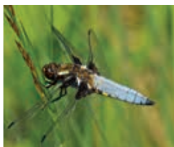
Libellule déprimée – G. Genoni

Rdv à la gare. Train de Lausanne 8h11, arr. 8h41. Un tour en ville puis dans la prairie sèche des Afforêts nous fera rencontrer le martinet noir, le torcol fourmilier, l'hirondelle de fenêtre et le cincle plongeur. 8 km de marche facile, pique-nique. Retour vers 16h, trains fréquents.