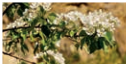
Poirier sauvage – Giulio Genoni