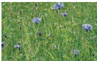
Bleuets - A. Maillefer

Train de Lausanne 7h58 (de Nyon 8h06), changer à Allaman, bus 720 8h25, arr. Combe des Amburnex 9h13 (parking). Marche facile, visite possible de zones humides, pique-nique. Retour 16h44.