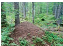
Fourmilière – A. Freitag