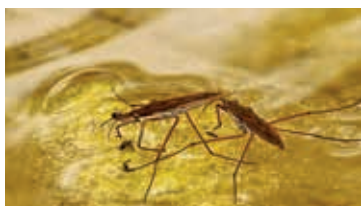
Gerris lacustre – G. Genoni

Rdv au parking au pied de la Chassagne, à 700 m de l'arrêt Onnens VD Croisée. Train de Lausanne 7h25, changer à Yverdon, bus 635 8h10, arr. 8h35. Retour vers midi, bus aux 15 et 50.