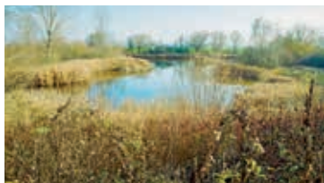
Etangs d'Arnex – C. Estermann

Rdv devant le bâtiment communal. Filet entomologique et appareil macro bienvenus. Balade dans les réserves agricoles de Pro Natura Vaud. Train de Lausanne 8h25, à Yverdon R21 8h46, à Vuiteboeuf bus 620 9h02, arr. Fontaines Collège 9h21. Parking: terrain de parapente au SO du village. Retour 12h23. Annulation si mauvais temps.