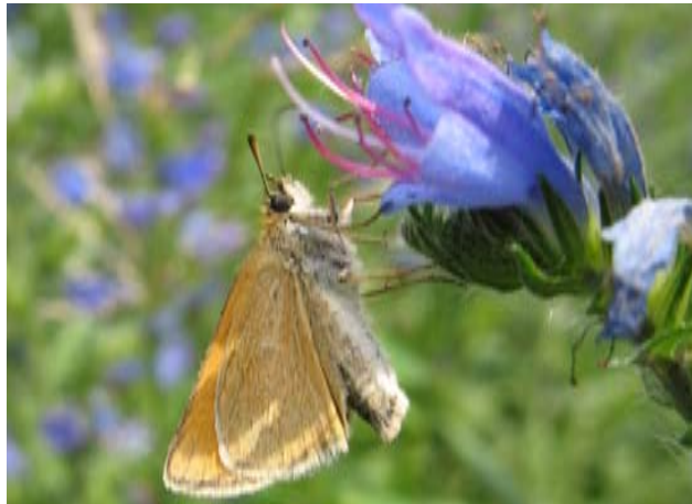
Ci-contre: une hespérie buttinant une fleur de vipérine.