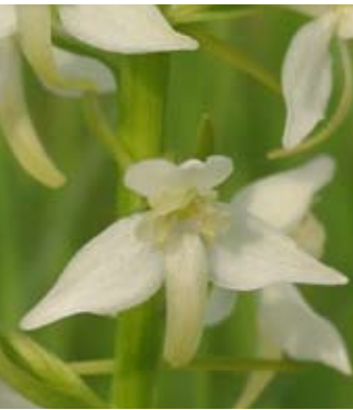
Ci-dessus: la platenthere à deux feuilles, une orchidée des talus.